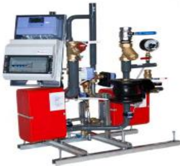
Bilde: Eksempel på en Høgfors kundesentral