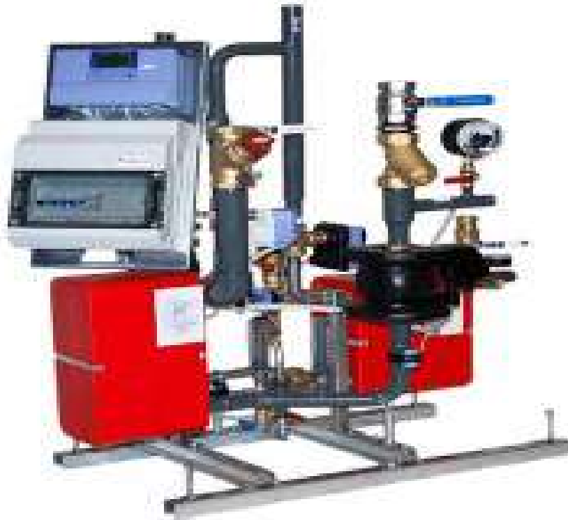
Bilde: Eksempel på en Høgfors kundesentral

Bruker Den juridiske enhet, selskap, sameie, eller fysiske person, som har inngått avtale med fjernvarmeleverandør om leveranser eller som bruker fjernvarme.